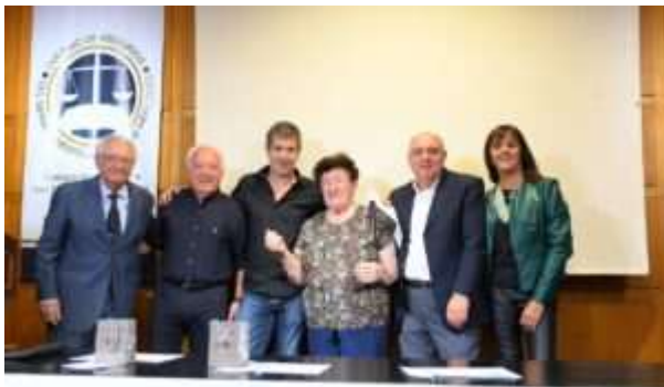
COLEGIO DE ABOGADOS DEL DEPARTAMENTO JUDICIAL DE M