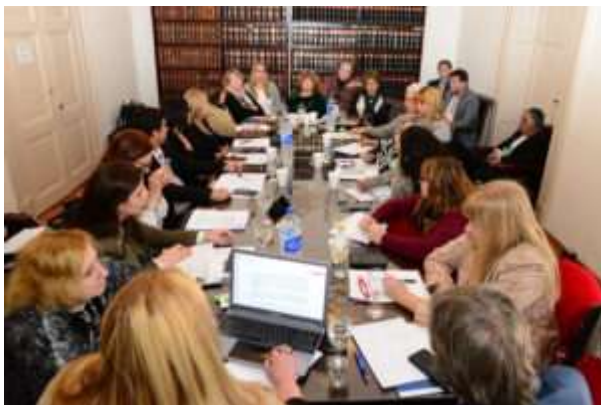
COMISION DE DERECHO AMBIENTAL Y AGRARIO