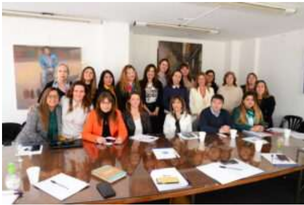
COMISION DE INCUMBENCIAS PROFESIONALES